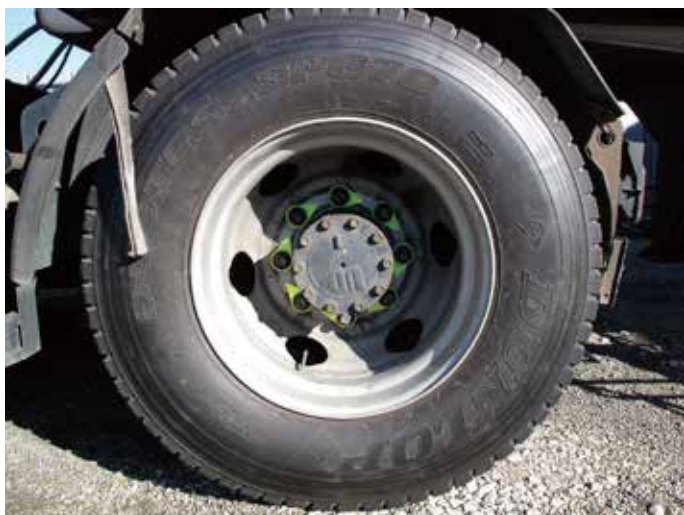
装着例：コンテナ用トレーラーヘッド リア 8穴 41mm