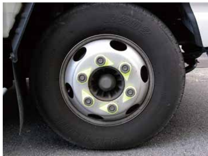
装着例：3tトラック フロント 6穴 41mm