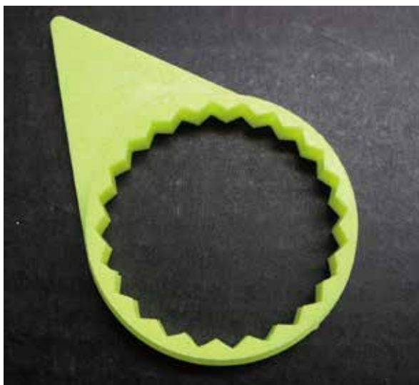
(写真は A1155 41mm)